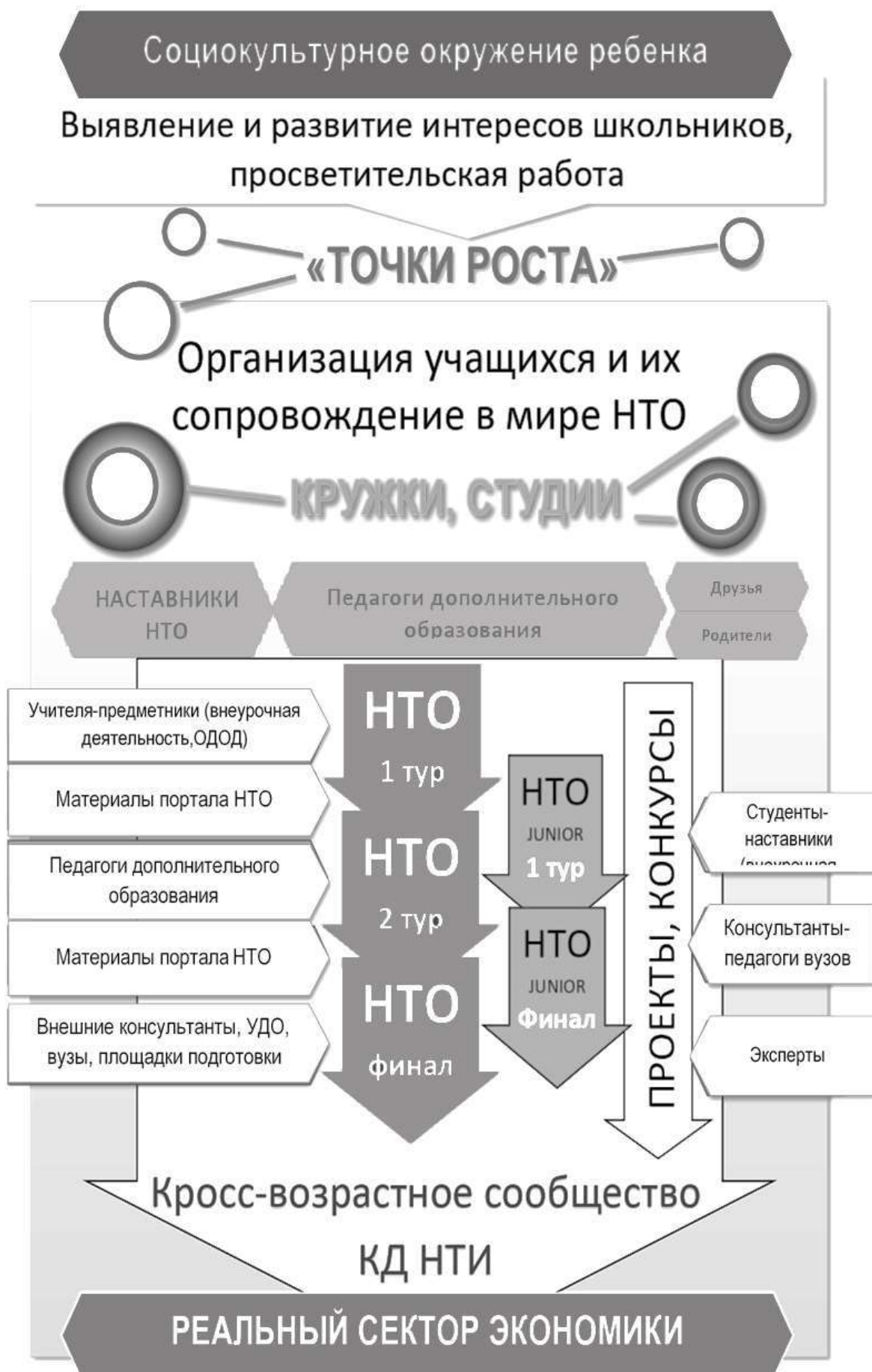
Рис 1. Алгоритм формирования кросс-возрастного сообщества